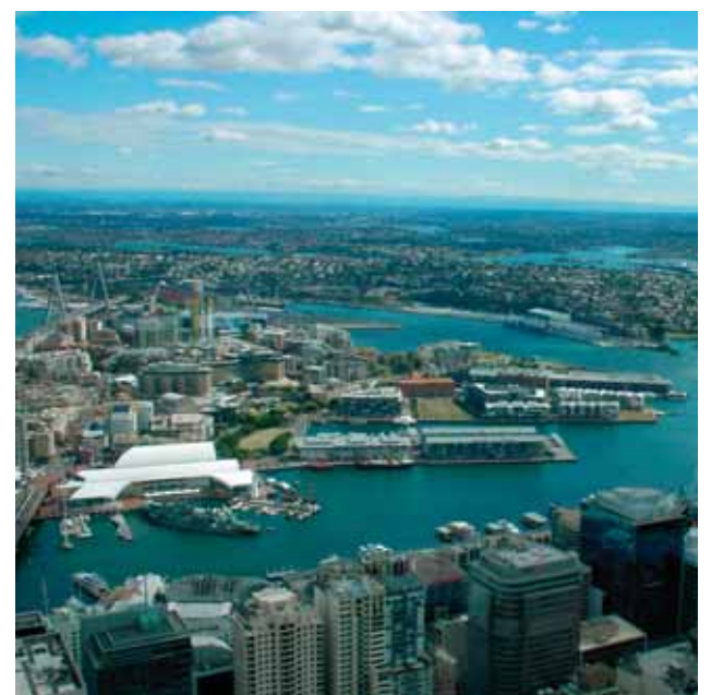
Sydney vanaf de top van de Toren van Sydney.

Voor een overzicht van de hervormingen op het gebied van relaties met mensen van hetzelfde geslacht zie www.ag.gov.au/samesexreform