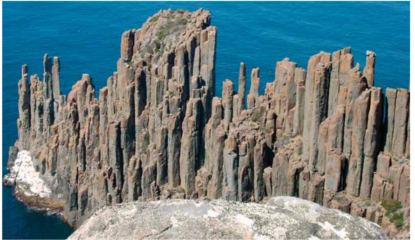
Cape Raoul, Tasmanië.