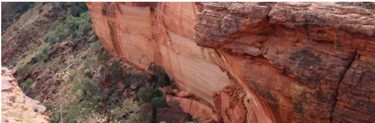
Kloof bij Kings Canyon, Noordelijk Territorium.

De brochure Social Security Agreement between Australia and Finland is verkrijgbaar via de Centrelink website www.centrelink.gov.au in het Fins, Zweeds en Engels. Deze kan ook aangevraagd worden bij Centrelink International Services – contactgegevens staan op pagina 4.