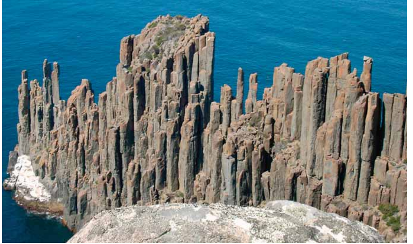
Cape Raoul, Tasmania. Fotoğrafi çeken Centrelink Uluslararası görevli memuru David Walch.