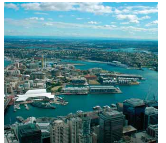
Sydney Kulesinden Sydney'in görünümü.

Bağlantı bilgilerimizi 4.sayfada bulabilirsiniz.