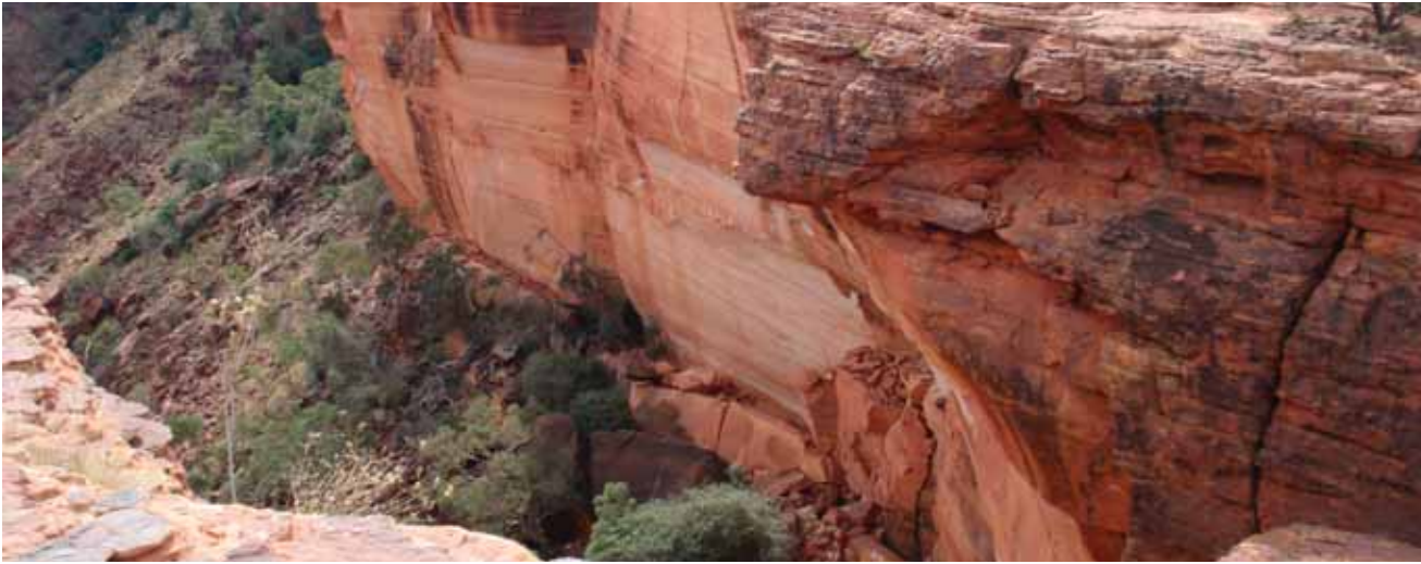
Kings Kanyonunda uçurum.